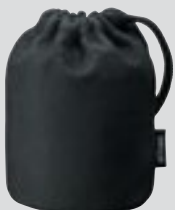
Objektivbeutel CL-1015 (im Lieferumfang)